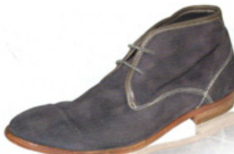
H by Hudson